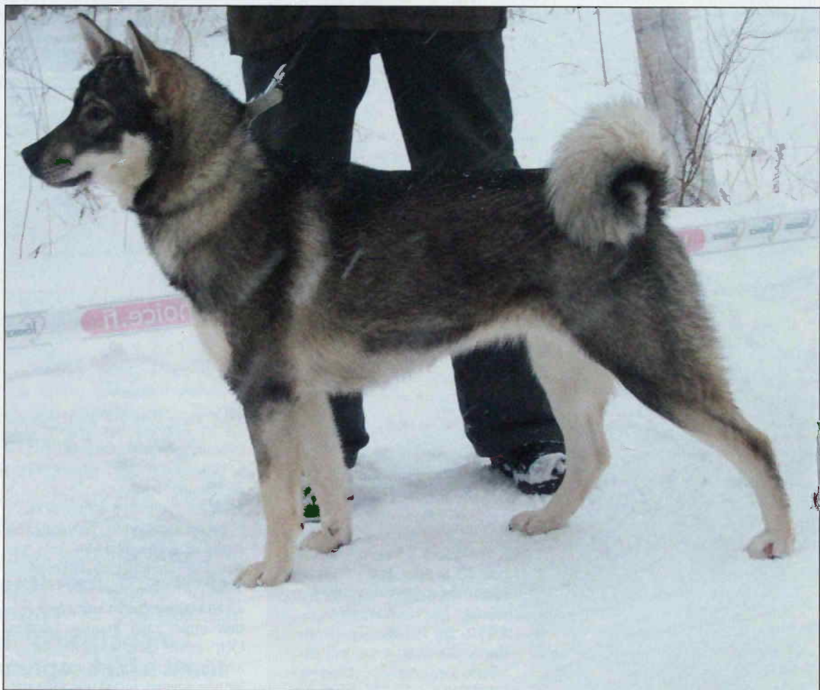
Onivaaran Odessa är en mycket lovande avelstik efter väldigt bra föräldrar (JCH Tainion Roni-DCH Raikukorven Gnippe). I kombinationen med Odessa-Silmeksen Jannu hade åtta av 14 valpar födda 22 februari 2010 tagit 1:a pris på jaktprov innan årets slut.

man skall komma ihåg att älgstammens utseende och möjliga störningar har riktigt stor betydelse.