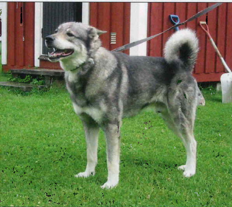
Dch Jojje lånades från Sverige 2006. Avkommorna är inte de allra tidigaste men startprocenten är mycket bra och det har blivit riktigt duktiga hundar. Tikarna efter Jojje har blivit snygga. Linjen fortsätter genom sonsonen Repomäen Le-genda som är en mycket lovande avelshane.